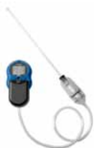
外置采样泵及探杆