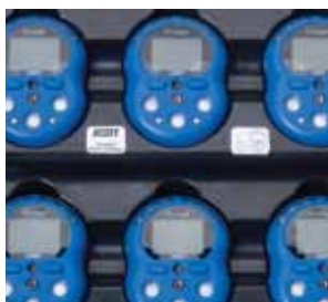
多仪器组合充电器