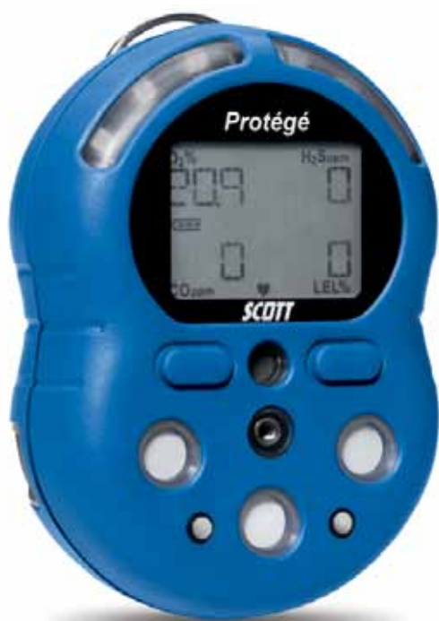
本图片与实物尺寸相同

Protégé 便携式四气体检测仪除可持续显示可燃气体、一氧化碳、硫化氢和氧气的浓度外，还可显示STEL值、TWA值、峰值，以及锂电池电量、标定提示等信息。仪器可根据实际情况选择使用或调整预设报警限值，以满足个性化需求。单独设置高/低浓度和STEL/TWA报警限值，可用于有毒有害环境工作人员的防护。